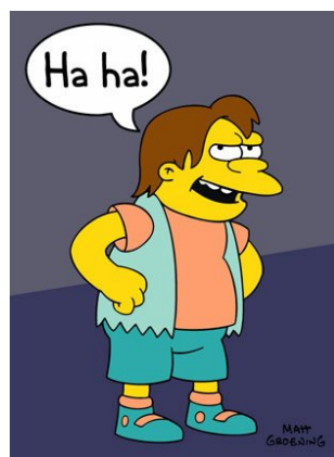
Figura 4: Nelson y la raíz cuadrada de 2

La raíz cuadrada de un millón es mil, lo que no tiene nada de misterioso. La observación de Nelson es mucho más interesante en la versión en español, donde se refiere a la raíz cuadrada de dos. Siendo un número irracional, la raíz cuadrada de dos tiene infinitos dígitos y, efectivamente, nadie nunca podrá conocerlos a todos.