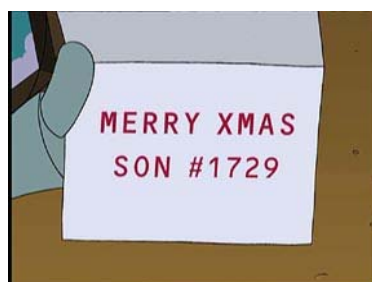
Figura 8: Bender 1729