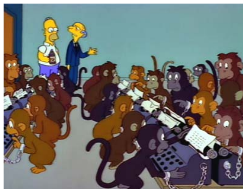
Figura 5: El teorema del millón de monos

Esto alude a un famoso enunciado, vinculado al cálculo de probabilidades: si un millón de monos aporrearan al azar un millón de máquinas de escribir, al cabo de un millón de años habrán escrito todas las obras de Shakespeare. Efectivamente, la cantidad de libros que se pueden escribir, dadas todas las combinaciones de letras en un volumen típico, es limitada. Dado el tiempo suficiente, cualquier dispositivo que genere combinaciones de letras al azar, necesariamente generarán todos los libros posibles, incluso los que aún no se han escrito.