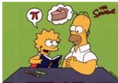
Figura 3: Homero se babea con \pi