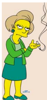
Figura 6: La maestra Krabappel

La maestra Krabbappel es nominada al premio de Maestra del año. Al final pierde el premio a manos de “Julio Estudiante, por haber enseñado a los estudiantes que las ecuaciones diferenciales son más poderosas que las balas”.